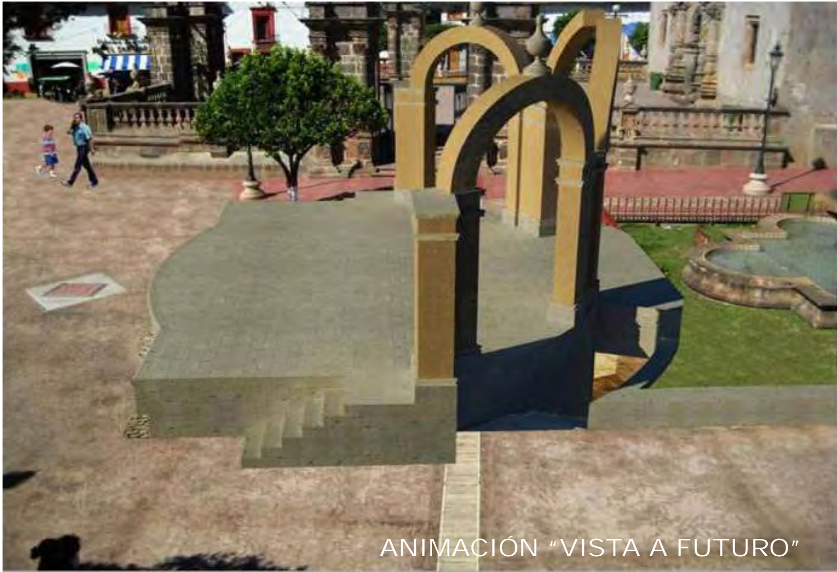
ANIMACIÓN "VISTA A FUTURO"